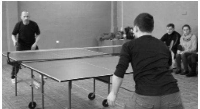
На заводском турнире по настольному теннису

Мы желаем нашим спортсменам удачных стартов и больших побед!