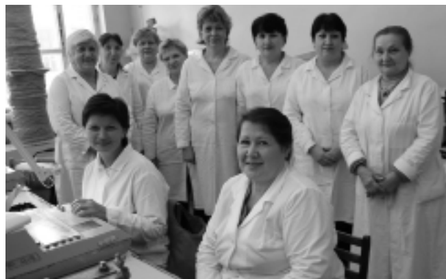
Участок по изготовлению моточных узлов