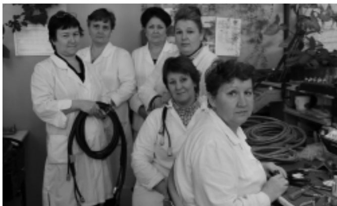
Участок по изготовлению кабельной продукции

Цех у нас относительно небольшой — 210 человек, зато номенклатура — самая разнообразная. Есть изделия, производство которых мы освоили ранее, — это «Арбалет» и «Акведук». Но в настоящее время заказы на них разовые. Для расширения номенклатуры цех занимается освоением новых позиций, отличающихся по своей специфике от тех, к изготовлению которых мы привыкли. Это комплекс блоков изделий производств 984, 180 и опытно-конструкторские работы по изделию «Медовуха».