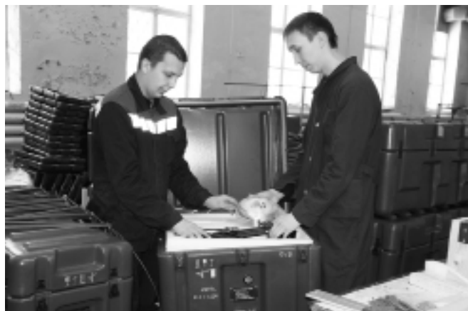
Участок упаковки готовых изделий