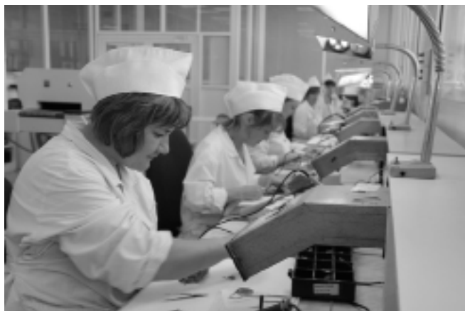
Участок поверхностного монтажа