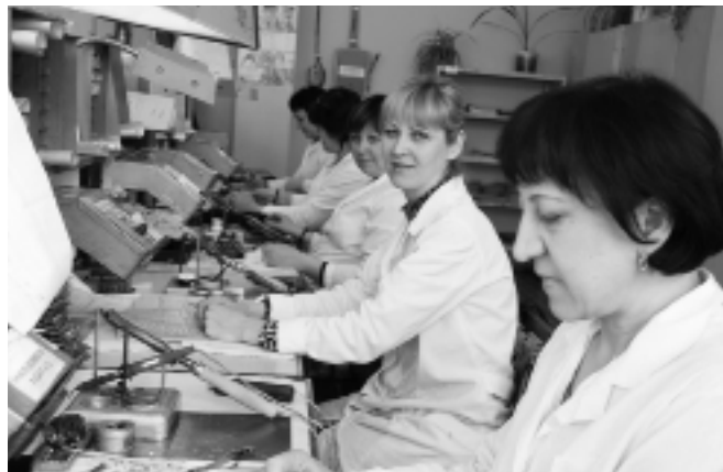
Участок ручной пайки и сборки