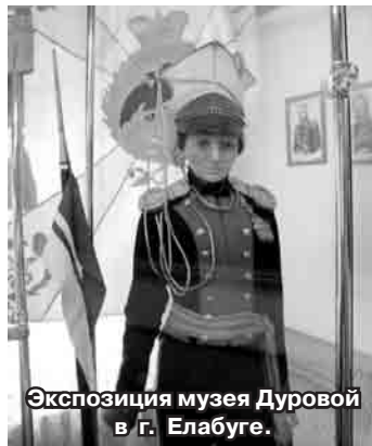
Экспозиция музея Дуровой в г. Елабуге.

В боях с войсками Наполеона в Восточной Пруссии в 1807 году Дурова была награждена Георгиевским крестом, который ей вручил лично император Александр I, разрешив продолжить службу под фамилией Александров. После вторжения