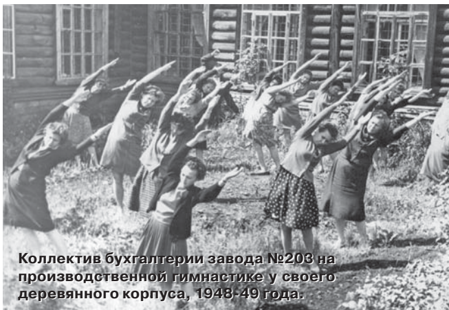
Коллектив бухгалтерии завода №203 на производственной гимнастике у своего деревянного корпуса, 1948-49 года.

Уходя своими корнями в сложную перипетию сменяющихся столетий, работники предприятия всегда жили прочностью и силой своих многочисленных традиций. Каждый новый год их насыщенной жизни вписывал в трудовую летопись завода немало больших и малых событий, фактов, без сомнения заслуживающих внимания молодого поколения заводчан.