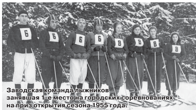
Заводская команда лыжников занявшая 1-е место на городских соревнованиях на приз открытия сезона 1955 года.