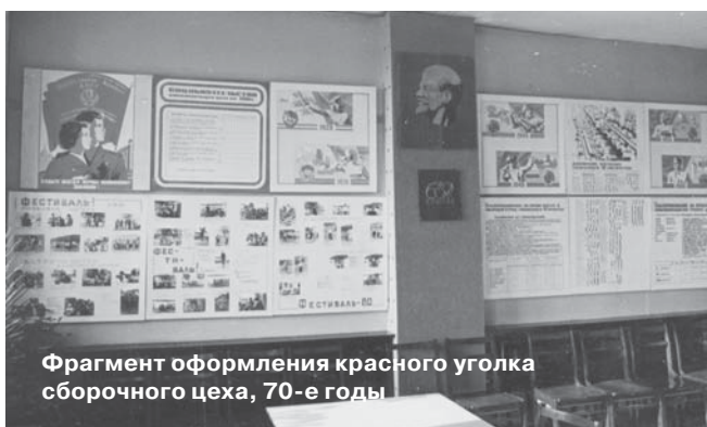
Фрагмент оформления красного уголка сборочного цеха, 70-е годы

В преддверии праздника «Дня трудовой славы завода» хочется вспомнить замечательные традиции отмечать трудовые достижения и лучших людей подразделений завода в виде оформления различных форм наглядной агитации. Особенно широко это проявилось начиная с 60-х годов прошлого столетия.