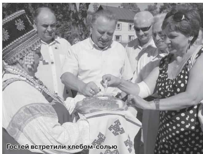
Гостей встретили хлебом-солью